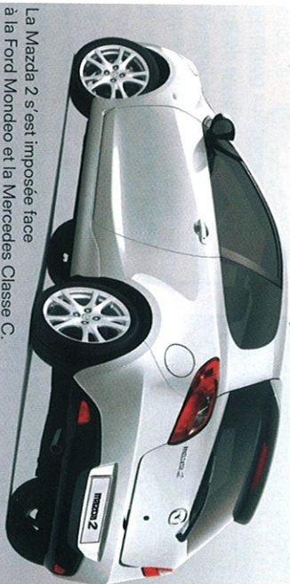
La Mazda 2 s'est imposée face à la Ford Mondeo et la Mercedes Classe C.

A l'occasion du New York International Auto Show, la Mazda 2 a été élue Voiture Mondiale de l'Année 2008. 39 voitures étaient en lice pour cette élection de la World Car of the Year 2008. La Mazda 2 l'a emportée devant la Ford Mondeo et la Mercedes Classe C. Fin de l'année dernière, la Mazda 2 avait déjà été sacrée "Gezinswagen van het Jaar" (voiture familiale de l'année).