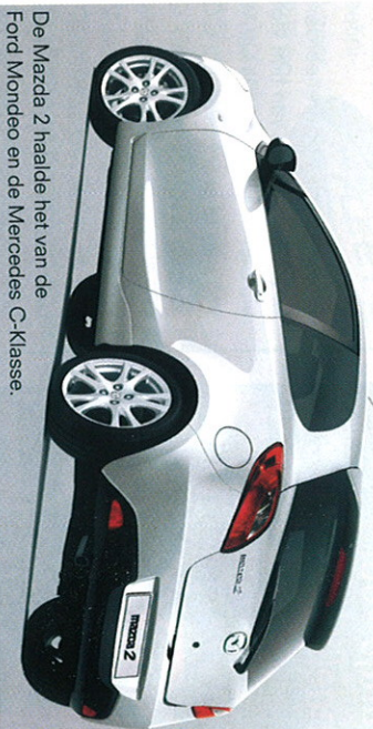
De Mazda 2 haalde het van de Ford Mondeo en de Mercedes C-Klasse.

Naar aanleiding van de New York International Auto Show werd de Mazda 2 uitgeroepen tot Wereld Auto van het Jaar 2008. Voor de World Car of the Year 2008 verkiezing kwamen dit jaar 39 nieuwe auto's in aanmerking. De Mazda 2 gaat in de einduitslag de Ford Mondeo en de Mercedes C-Klasse vooraf. Eind vorig jaar werd dezelfde Mazda 2 in ons land nog verkozen tot de Gezinswagen van het Jaar.